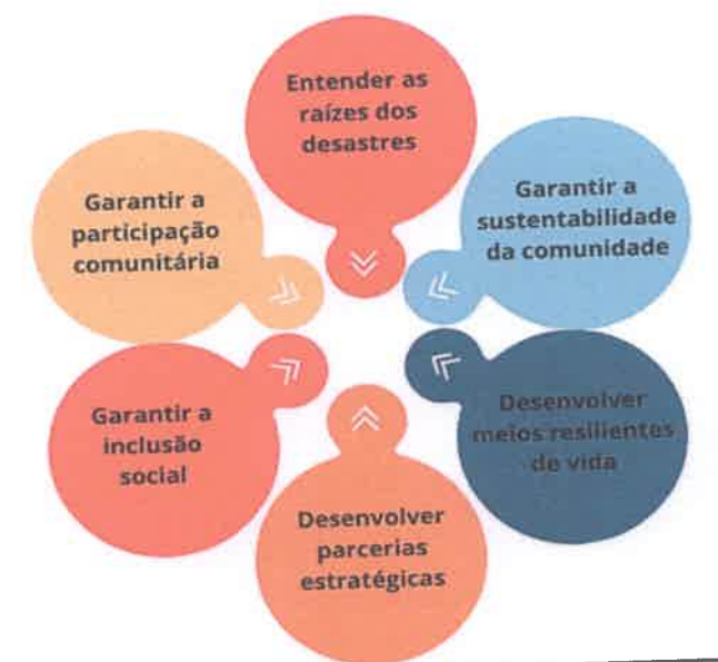
Figura 1 – Princípios norteadores para mobilização comunitária

Programas de educação podem incluir treinamentos, workshops , palestras e campanhas informativas. Com uma população bem-informada, aumenta-se a capacidade de resposta rápida e eficaz durante desastres, reduzindo danos e salvando vidas. A Figura 1 apresenta os princípios norteadores para mobilização comunitária.