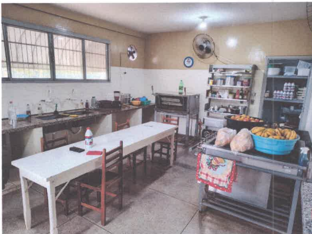
Imagem 1 – Cozinha