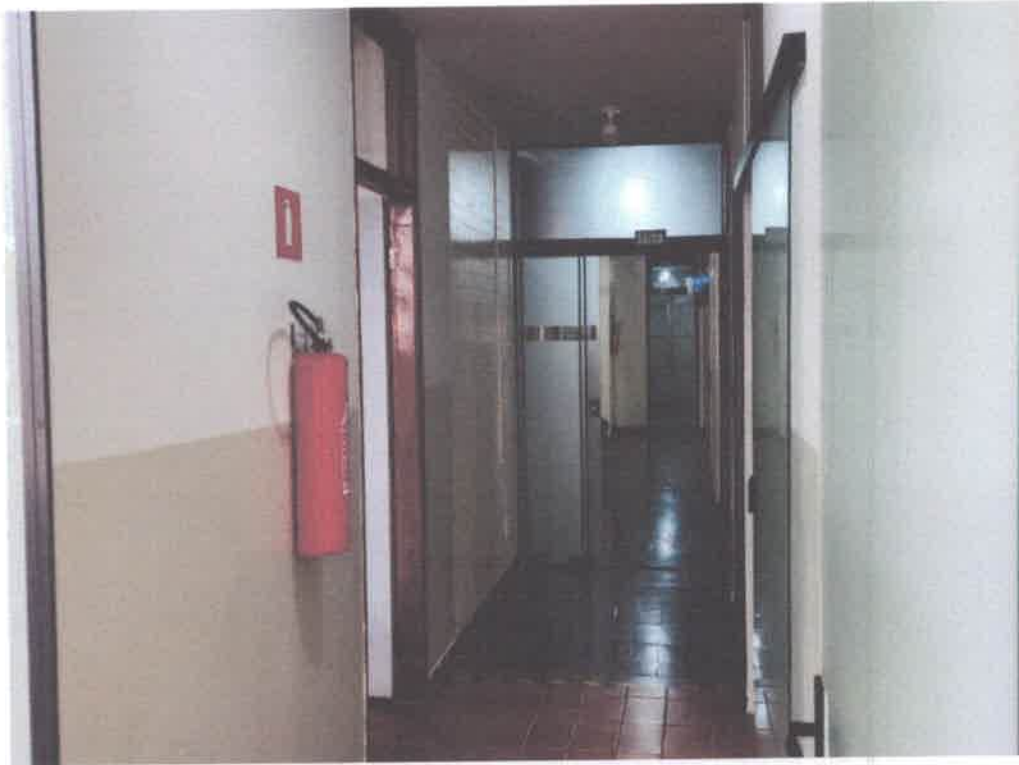
Imagem 8 – Sala de observação e procedimentos