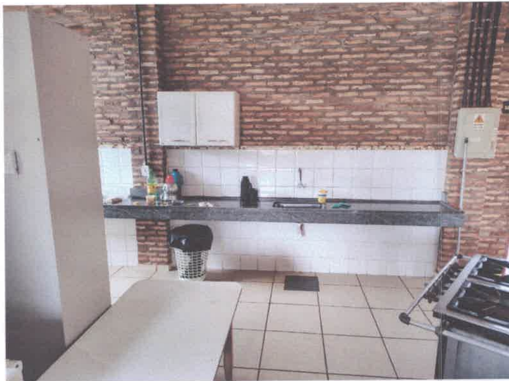
Imagem 1 – Cozinha