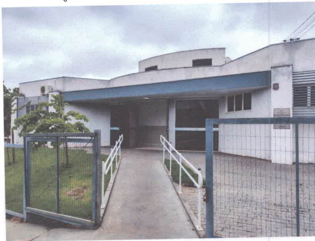
Imagem 9 – Fachada, rampa de acesso e entrada principal

Praça da Bandeira nº 69 – Centro – CEP 15.730-000 Telefone – (17) 3695-1101 – Fax (17) 3695-1101