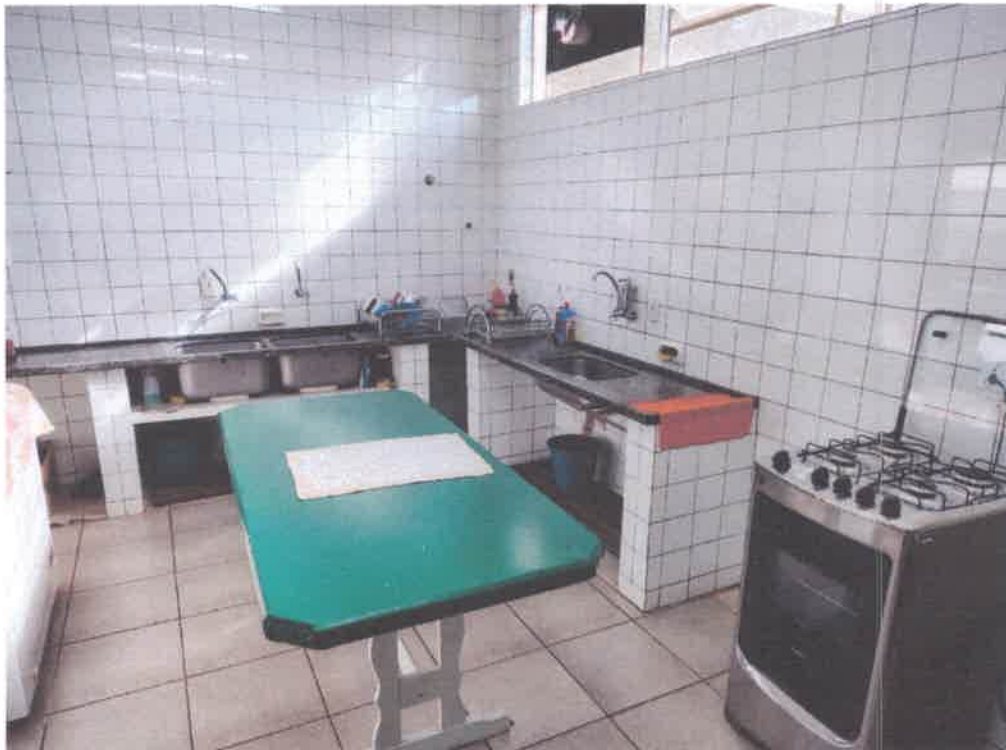
Imagem 1 – Cozinha