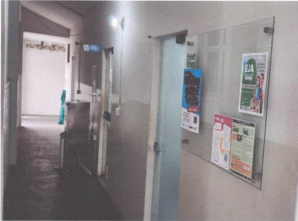
Imagem 15 – Salas de atendimento e bebedouro público

Telefone – (17) 3695-1101 – Fax (17) 3695-1101