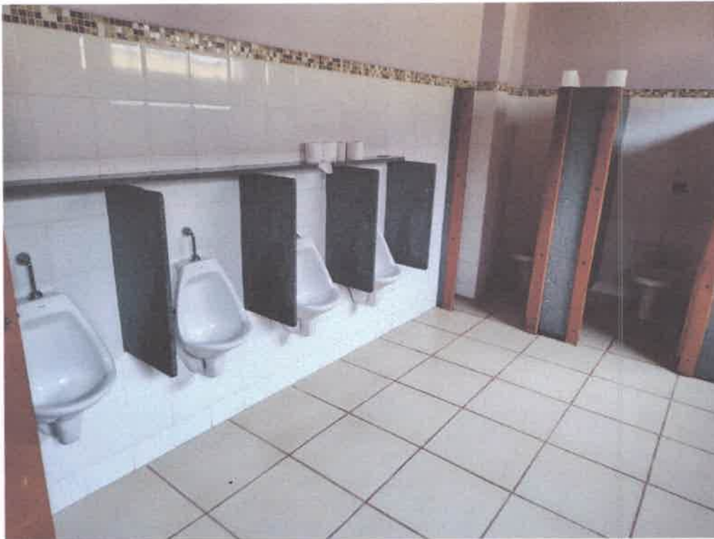
Imagem 8 – Sanitário

Telefone – (17) 3695-1101 – Fax (17) 3695-1101